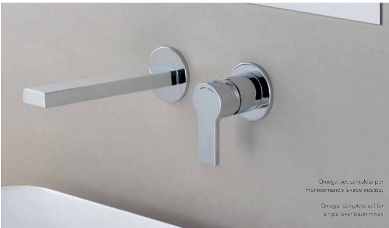
Omega, set completo per monocomando lavabo incasso.