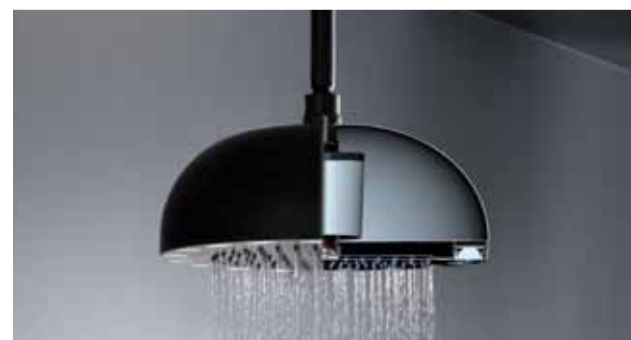
DYNAMO SHOWER A glance inside the technology of the new shower head, equipped with a turbine that creates energy from the water flow.