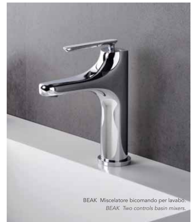
BEAK Miscelatore bicomando per lavabo. BEAK Two controls basin mixers.