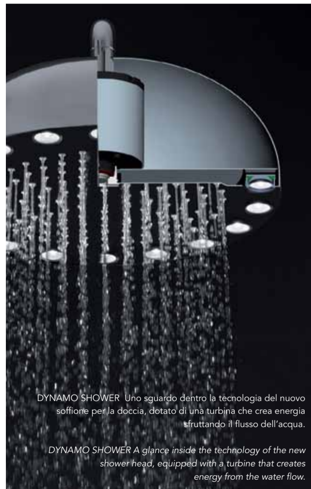
DYNAMO SHOWER Uno sguardo dentro la tecnologia del nuovo soffione per la doccia, dotato di una turbina che crea energia sfruttando il flusso dell'acqua.

Chromotherapy is a fascinating holistic discipline based on the belief that colors have a healing effect on our organism: as red can be useful against low blood pressure, orange can raise happiness. Green, on the contrary, provides serenity: it's perfect for who suffers insomnia and sleep disorders. Yellow relieves digestion diseases and helps in concentration, while violet is beneficial for nervous system and stimulates creativity. Obviously, chromotherapy can be applied in many ways: a lot of SPA take advantage of the healing effects of the "chromatic irradiation" in and out of water.