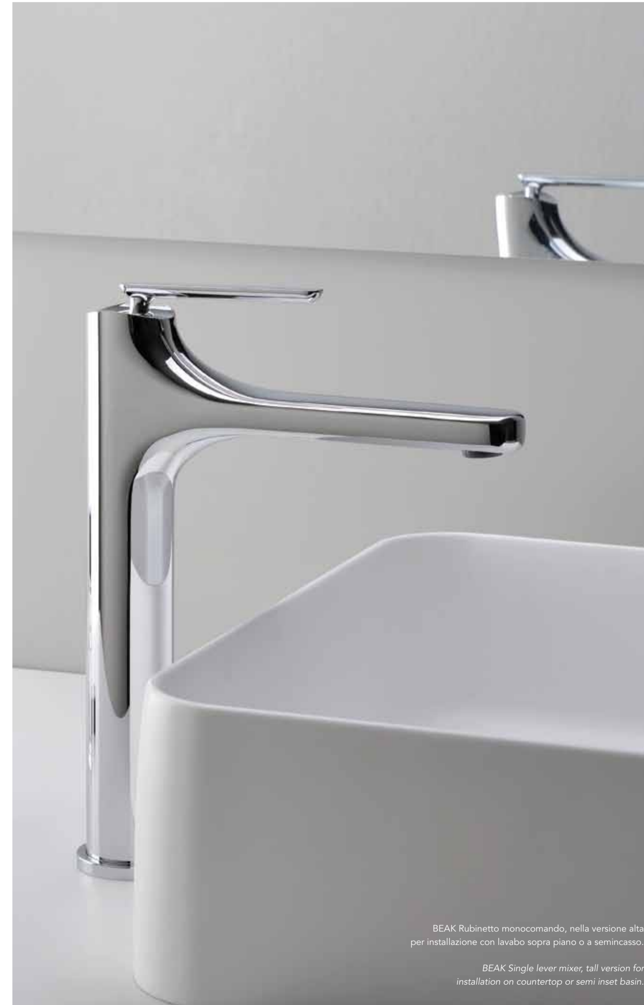
BEAK Rubinetto monocomando, nella versione alta per installazione con lavabo sopra piano o a semincasso.

The simple, fine and elegant style that distinguishes BEAK has given us the possibility to make this tap in different models holding fast to the original idea : if the fine line of the single lever matches harmoniously the sculptural body of the tap, you have the same feeling in the two controls version even if with different volumes. The single lever mixer is also available in the "tall" version for installation on countertop or semi inset basins. A complete collection that includes bath, shower and bidet mixers : a wide range of products to meet several customers demands. All conceived with innovative technologies, attention to water-savings and first quality raw materials: CRISTINA, in fact, provides a 5-years warranty of the mechanical parts and of the outer surface finish (chromium plating). That's because we know how our products are made.